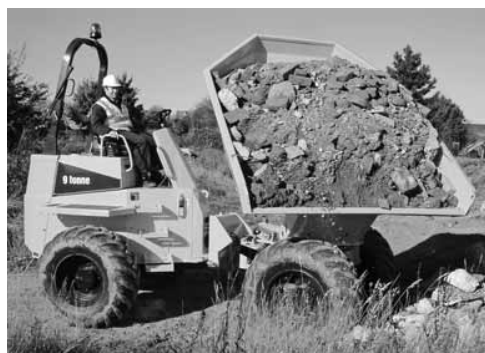
Übung macht den Meister. Training für Extremsituationen.