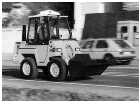
Auf öffentlichen Strassen müssen die Fahrzeuge gemäss SVG ausgerüstet sein und die Fahrer einen Ausweis der Kategorie F besitzen.