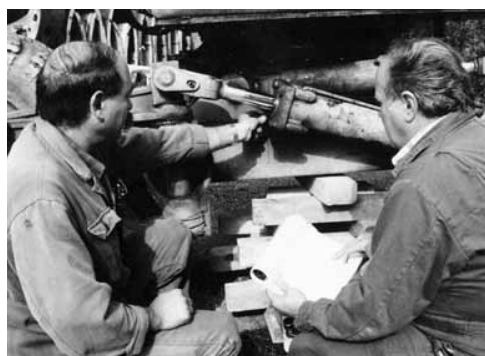
Mitarbeiterschulung am Gerät.