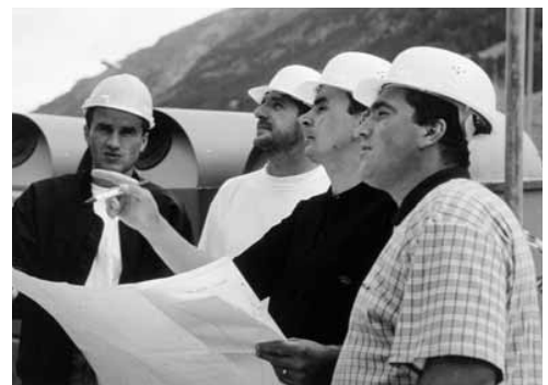
Ein geplanter, bestimmungsgemässer Einsatz der Geräte erhöht die Sicherheit.

Es ist möglich, dass in Ihrem Betrieb noch weitere Gefahren zum Thema dieser Checkliste bestehen. Ist dies der Fall, treffen Sie die notwendigen Massnahmen (siehe Rückseite).