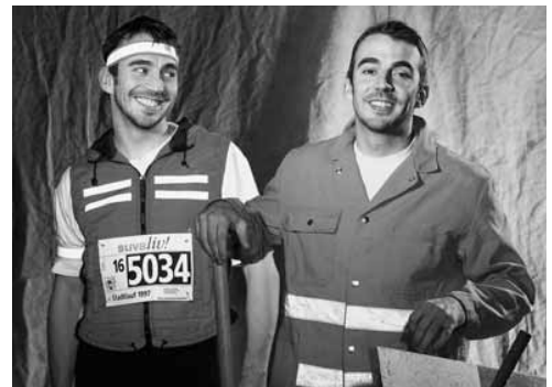
Im Verkehrsbereich Warnkleider tragen – sowohl bei der Arbeit wie auch in der Freizeit! Es kann einem das Leben retten, wenn man alle Blicke auf sich zieht.